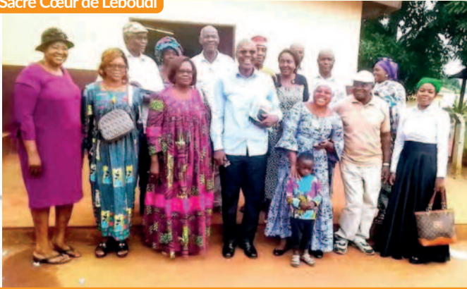
Conseil paroissial, dimanche 07 juillet 2024