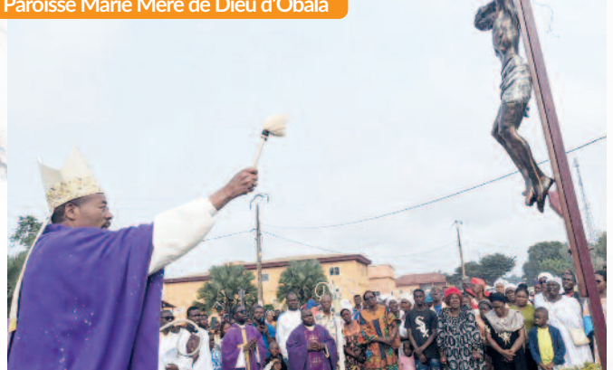
Purification de l'Eglise et bénédiction de la nouvelle croix, le 10 août 2024