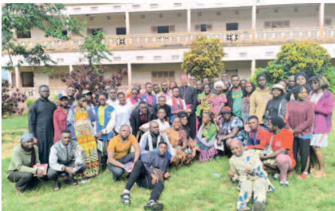
Session des accompagnateurs de la province ecclésiastique de Yaoundé, du 30 juillet au 05 août 2024, au petit séminaire Saint Joseph d'Efok