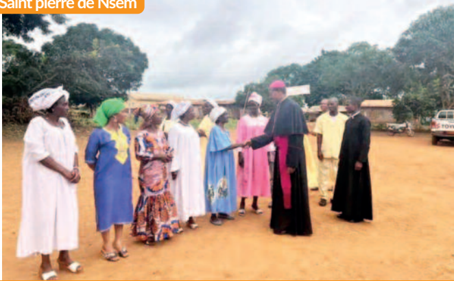
Visite pastorale du père évêque, dimanche 21 juillet 2024