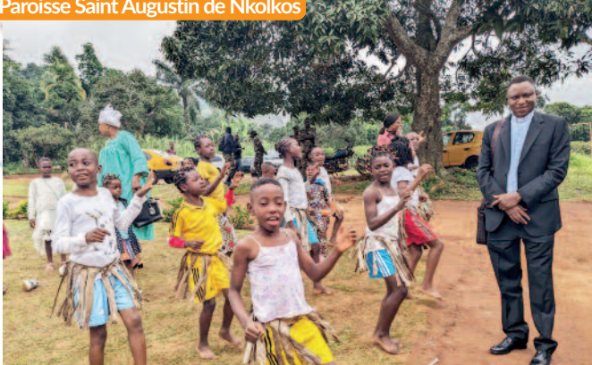
Solennité de l'assomption, le 15 août 2024