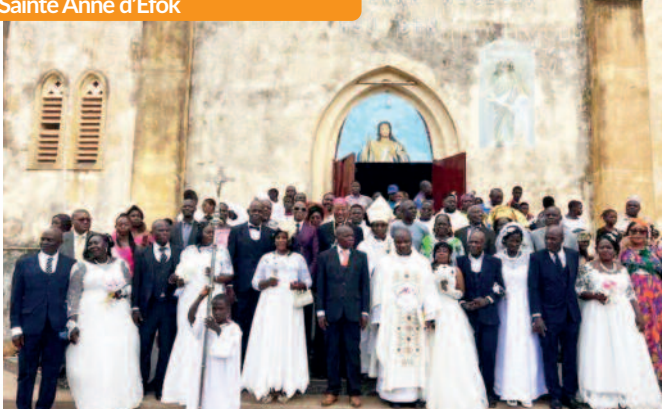
Fête patronale, dimanche 28 juillet 2024