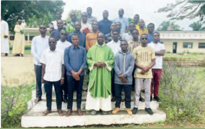
Session annuelle des grands séminaristes, du 07 au 14 juillet 2024, au collège Joseph Stintzi