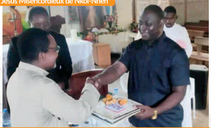
Passation de service entre le curé entrant et sortant, mardi 23 juillet 2024