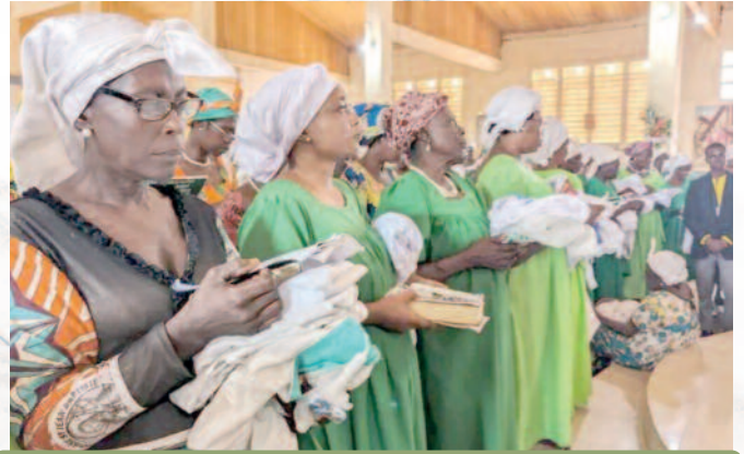
Pèlerinage diocésain des dames apostoliques, du 09 au 10 juillet 2024, à la paroisse Saint Michel de Mokolo