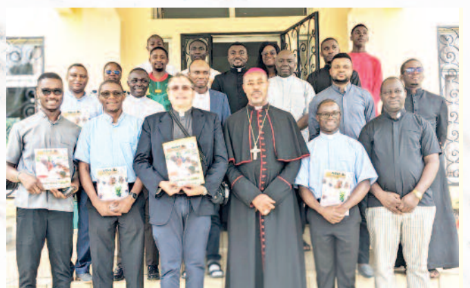
Visite des responsables du collège Urbano de Rome, le 16 août 2024