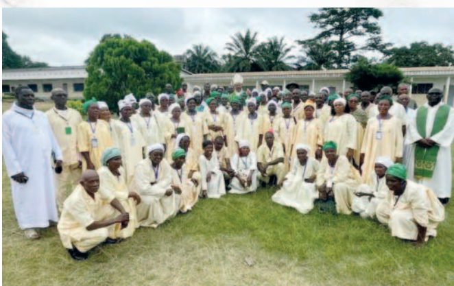
Retraite spirituelle des catéchistes, du 12 au 14 août 2024, au collège Joseph Stintzi