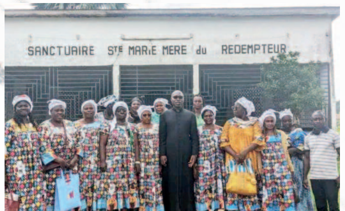
Assemblée générale des CECl, vendredi 02 août 2024, à la paroisse Marie Mère d'Obala