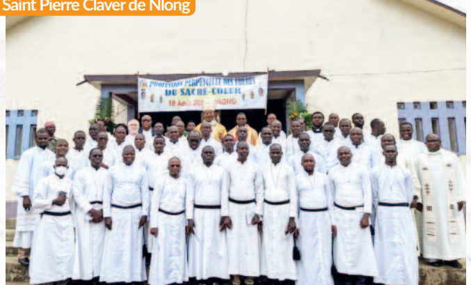
Profession perpétuelle des prêtres du sacré Cœur; le 18 août 2024