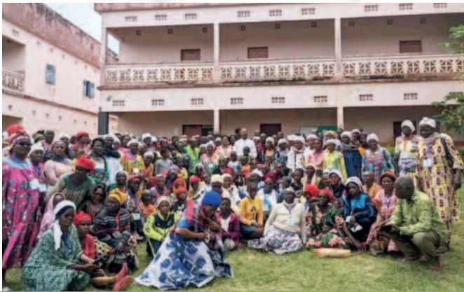
Retraite annuelle du nouveau charismatique, du 16 au 18 juillet 2024, au petit séminaire Saint Joseph d'Efok