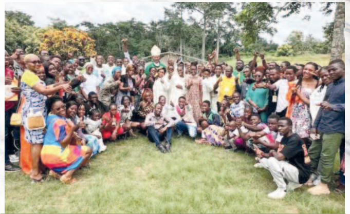
Session diocésaine des jeunes, du 21 au 29 juillet 2024, au petit séminaire Saint Joseph d'Efok