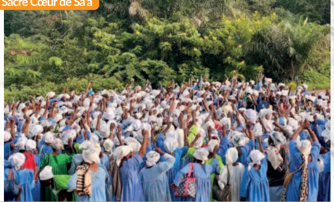
Pèlerinage diocésain de l'ékoan maria, du 24 au 26 juillet 2024